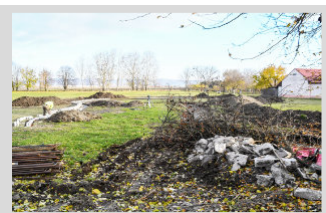
Prehľad investičných akcií zrealizovaných v roku 2024 ► str. 2