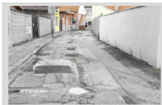
Čo máme v pláne vybudovať v roku 2025 ► str. 3