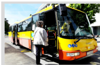
Zmeny tarifných podmienok v MAD ► str. 7