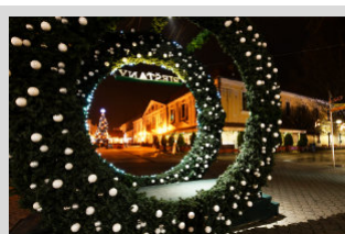
Tohtoročné vianočné trhy pripravuje samospráva ► str. 6