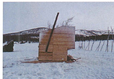
příklady sáun v přírode