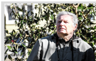
Rýdzo piešťanské ▶ str. 7