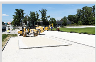
V meste sa realizuje množstvo investičných akcií ▶ str. 2 - 4