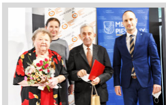
Ocenili sme dlhotrvajúce manželstvá ▶ str. 5