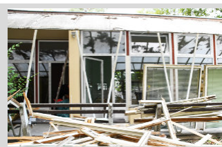
Čo sa v meste buduje