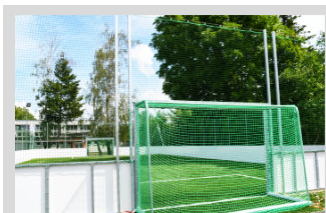
Investície do škôl