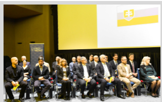
Primátor mesta a poslanci mestského zastupiteľstva ► str. 2