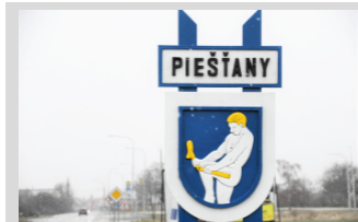
Štatistické údaje roku 2022 ► str. 4