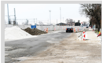
Prehľad investičných akcií v roku 2023 ► str. 3