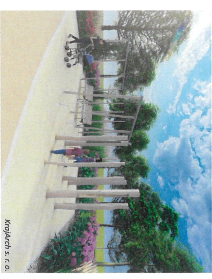
Vizualizácie akustického objektu harfy