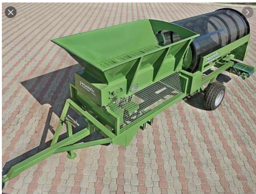
Obr. 1 Bubnový rotačný triedič PEZOLLATO L 3000 MINI

Prikladáme fotodokumentáciu jestvujúceho stavu a cenovú ponuku dopravníka kompostovej zeminy, dĺžka 4 500 mm a šírka 600 mm s nastavovateľnými profilmi, od firmy DINTECHNIK spol s.r.o., Pekná cesta 15, Bratislava v sume 11 940,00 € s DPH.