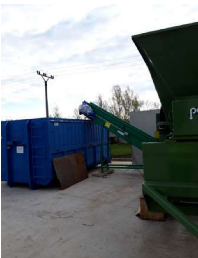
Obr. 3 Bubnový rotačný triedič PEZOLLATO L 3000 MINI – dopravníkový pás na nepreosiaty odpad (zdroj: Kompostáreň PN)