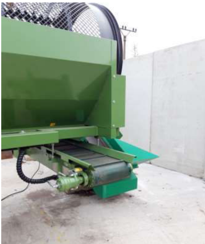
Obr. 2 Bubnový rotačný triedič PEZOLLATO L 3000 MINI – miesto vypadávania preosiateho kompostu