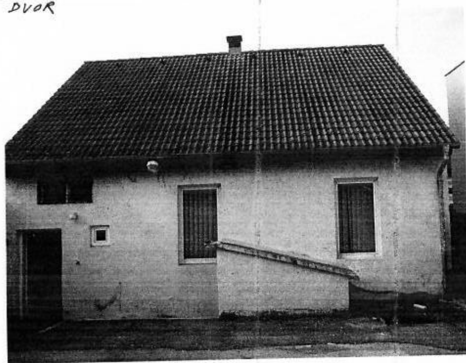
POHLÁD Z DVORA