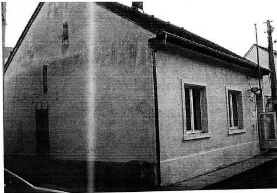
POHLÁDY OD ULICE