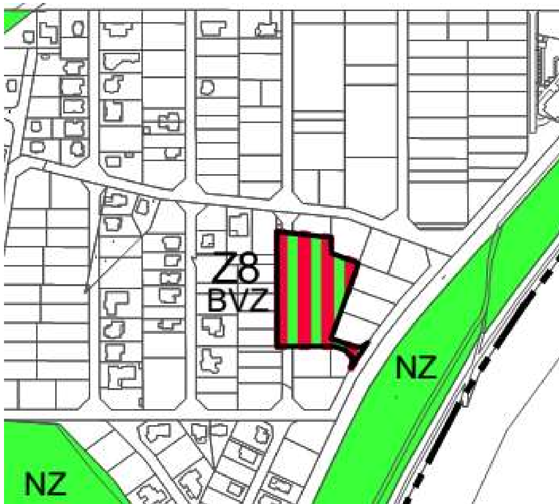
Funkčné využitie plôch – ZaD ÚPN č. 10/2011